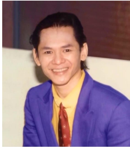
Rajah 2: Foto Sudirman Arshad (1954-1992)