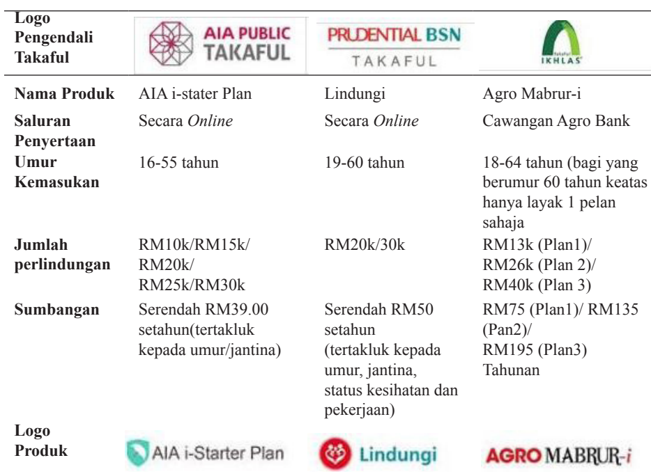
Jadual 10: Pelan Perlindungan yang Menepati Perlindungan Tenang

Sumber: Laman sesawang Malaysia Takaful Association, 2019. 126