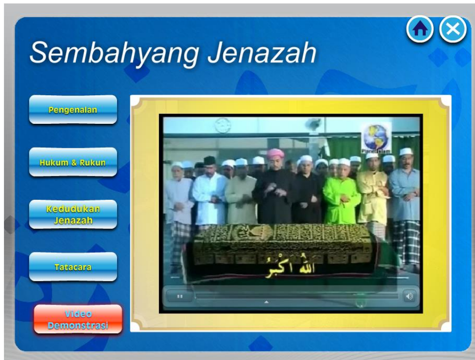
Rajah 2d Skrin Persembahan Maklumat (Video)