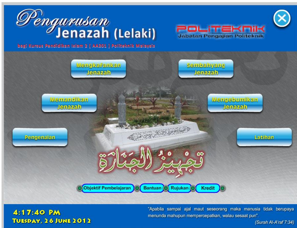
Rajah 2a Skrin Menu Utama

Proses penilaian dilakukan terhadap perisian yang dibangunkan bagi mendapatkan maklum balas yang berkesan untuk menentukan kejayaan kajian ini. Proses penilaian ini terdiri daripada penilaian formatif dan penilaian sumatif. Perisian PPBK Pengurusan Jenazah ini menggunakan beberapa instrumen kajian bagi mendapatkan penilaian yang dikehendaki daripada responden kajian. Instrumen kajian ini terdiri dari set soal selidik (penilaian sumatif), set senarai semak (penilaian formatif) dan set temu bual berstruktur (penilaian formatif). Instrumen kajian ini digunakan dalam setiap fasa model reka bentuk ADDIE. Seramai 40 orang pelajar semester 3 dan 16 orang pensyarah daripada politeknik di negeri Perak terlibat dalam penilaian sumatif ini. Set soal selidik ini dibahagikan kepada empat bahagian, iaitu bahagian A (keperluan sukatan dan kurikulum), Bahagian B (elemen multimedia), Bahagian C (struktur pengajaran dan pembelajaran), dan Bahagian D (aspek interaktif dan mesra pengguna). Rajah-rajah berikut menunjukkan beberapa snapshot yang diambil daripada perisian dibangunkan (Rajah 2a, 2b, 2c, 2d dan 2e).